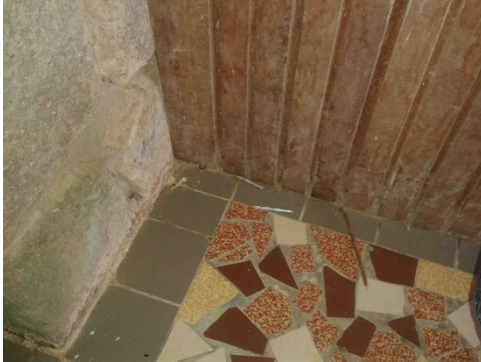
RDC – Présence de fèces dans l’huissierie des portes