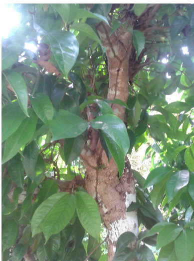
Zone de contrôle – Présence de galerie tunnel sur les arbres