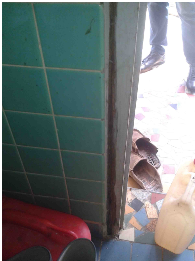
RDC – Présence de fèces et de tunnel dans l’huissierie des portes