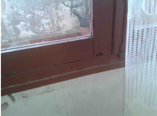
Étage – huisserie altérée