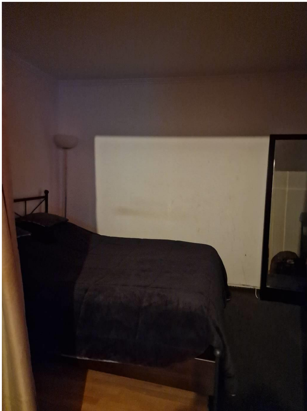
Chambre 1 par séjour