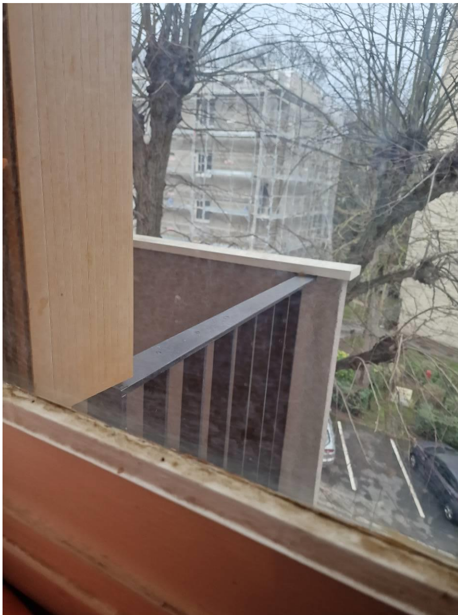
Séjour avec balcon