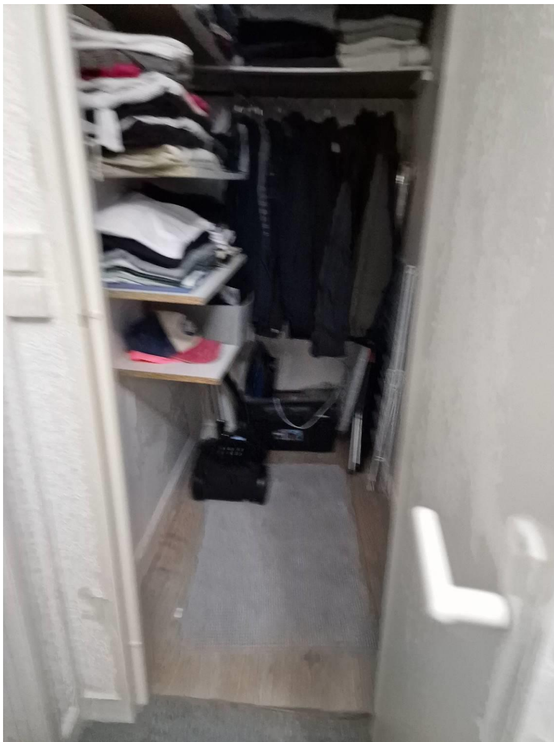
Débarras au fond du couloir