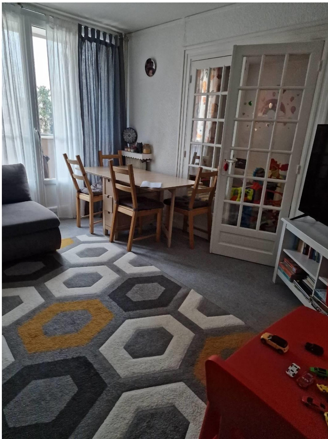
Salle de séjour